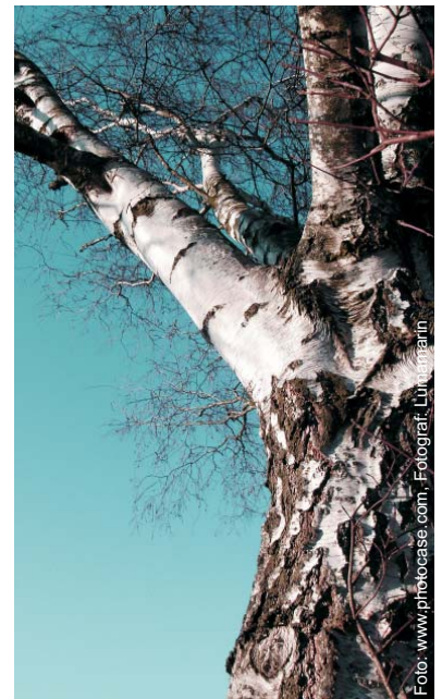
Ursprünglich wurde Xylit aus dem Holz von Birken gewonnen.

Zucker macht dick, lässt Pickel sprießen, erhöht das Herzinfarktrisiko, lässt den Blutdruck steigen, gleichzeitig die Vitamin- und Mineralienvorräte des Körpers schwinden und